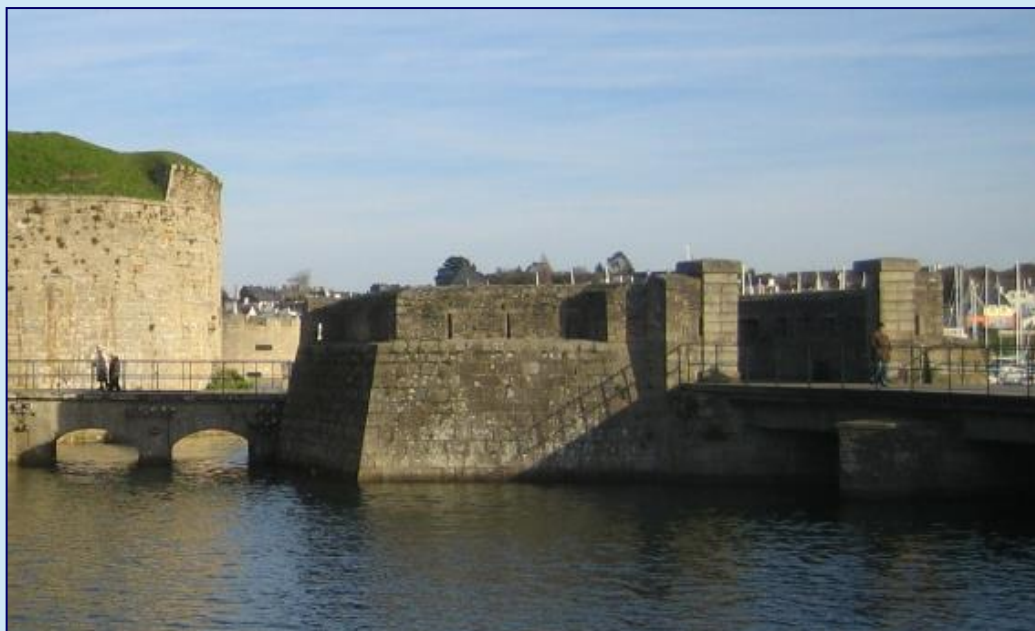
Le ravelin et le pont d'entrée