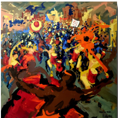
Michel Costiou, Mémoire de Carnaval , Acrylique sur toile

« Michel Costiou, maître du dessin du mouvement, est régulièrement invité à réaliser des reportages graphiques à l'encre de chine sur papier « en live » lors de spectacles à l'Opéra National de Paris, au Moulin Rouge, au Cirque d'Hiver Bouglione, au Cirque Gruss, au Palais de Chaillot, aux Festivals Celtiques, à la Garde Républicaine, au Carnaval de Salvador de Bahia... D'après ces « prises de note » in situ, Costiou réalise, dans l'intimité de son atelier, des œuvres de grand formats à l'acrylique et encre sur toile. Plusieurs « reportages graphiques » font partie des collections de la Bibliothèque Nationale de France, de la Bibliothèque-musée de L'Opéra de Paris, du centre National de la Danse, du Mucem, du Musée départemental Breton, et diverses collections privées en France et à l'international.