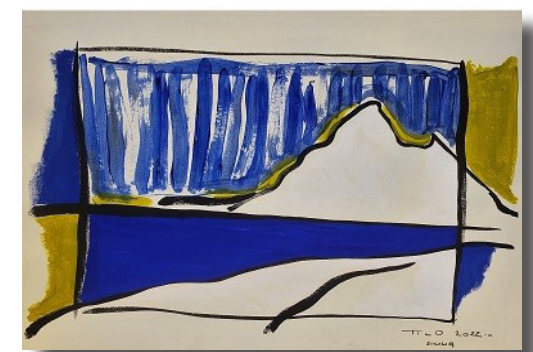
Thierry Lo, San Vito Lo Capo 10 , gouache sur papier

Atelier : 30 rue de Courcy Visite sur rendez-vous Contact : 06 07 26 68 71