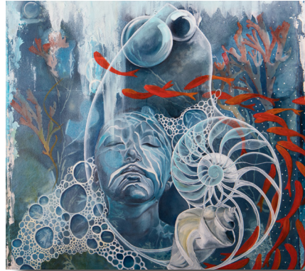
Béa Herry, Abysses , Huile et techniques mixtes sur toile

Atelier : 9 rue Villebois Mareuil Contact : 06 23 31 00 63