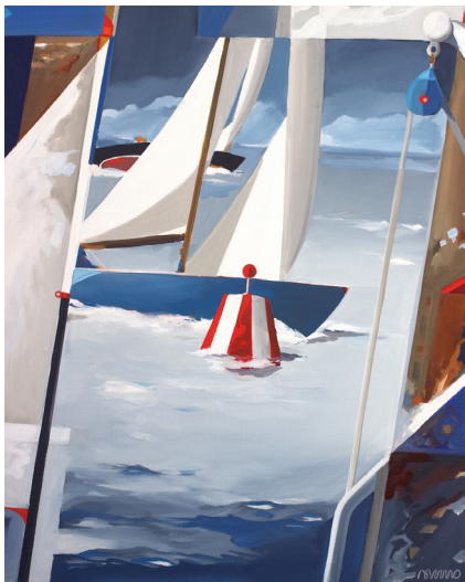
Bruno Blouch, Longer , huile sur toile